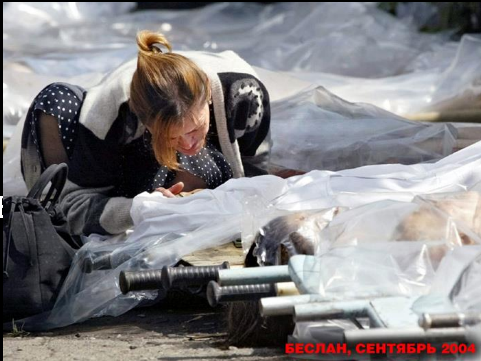
БЕСЛАН, СЕНТЯБРЬ 2004