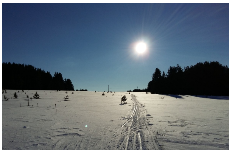
2 место Орлова Ксения