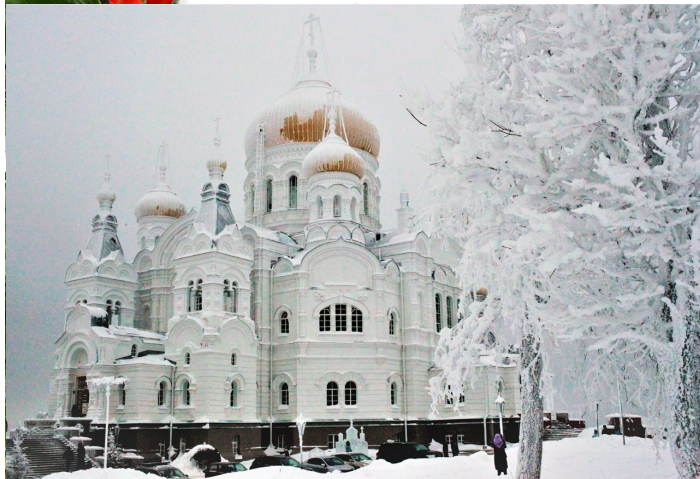
1 место Щербицкая Екатерина