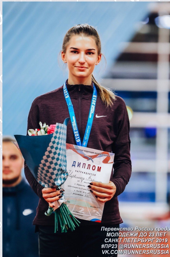
Первенство России среди МОЛОДЕЖИ ДО 23 ЛЕТ САНКТ ПЕТЕРБУРГ 2019 #ПР23 @RUNNERSRUSSIA VK.COM/RUNNERSRUSSIA

Спортом я начала заниматься ещё до школы, где-то в 5 лет, а вот в 5 классе я пришла в легкую атлетику. Так сложилось, что я попала к великолепному тренеру, который привёл меня к хорошим результатам. И уже в 11 классе, сразу после сдачи ЕГЭ, я переехала в Москву к новому тренеру и новым победам. Сейчас я живу в Москве, заканчиваю университет и продолжаю заниматься своим любимым делом .