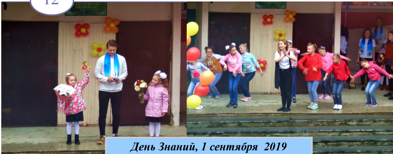
День Знаний, 1 сентября 2019