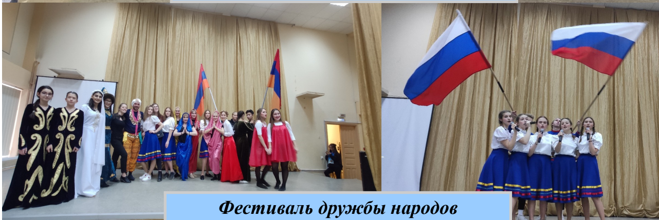
Фестиваль дружбы народов

«ПРОнас». Газета школы №163. №55 Апрель - Май 2020